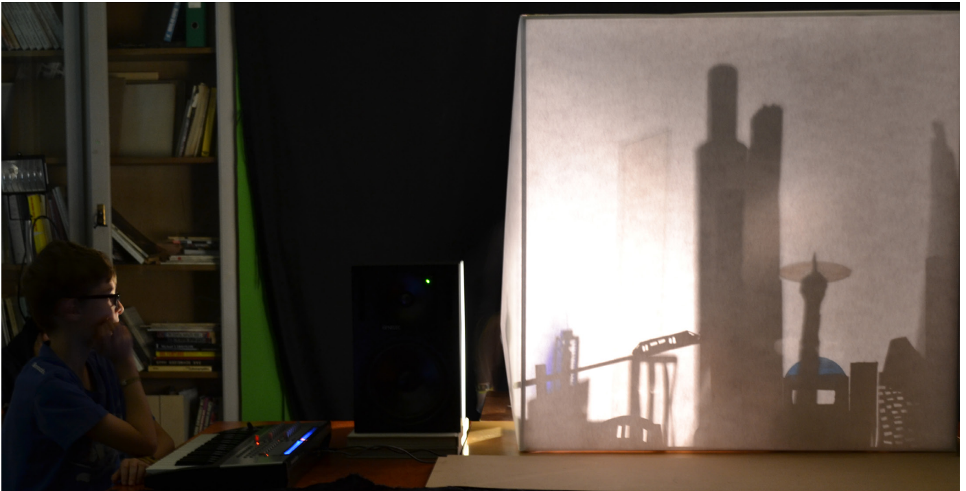
Ansicht des «Schattentheaters» an der Schlusspräsentation