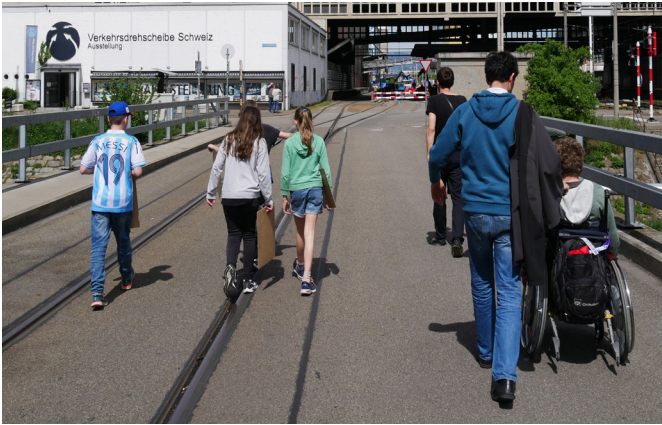
Unterwegs zum Hafenaerial im Klybeck Basel

Kinder und Jugendliche im Alter von 10–16 Jahren erkunden mit Kamera, Tonaufnahmegerät, Papier und Stift verschiedene Quartiere der Stadt Basel. Sie sammeln Eindrücke, Zeichnen, Fotografieren und machen Tonaufnahmen. Zurück im K'Werk lernen sie, gemeinsam aus dem gesammelten Material eine StadtplanCollage mit Bildern und gebauten Objekten zu erstellen und den passenden Soundtrack zu produzieren.