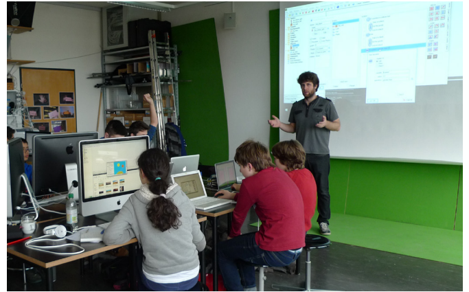
Erste Schritte bei der konkreten Umsetzung der Spielidee am Computer