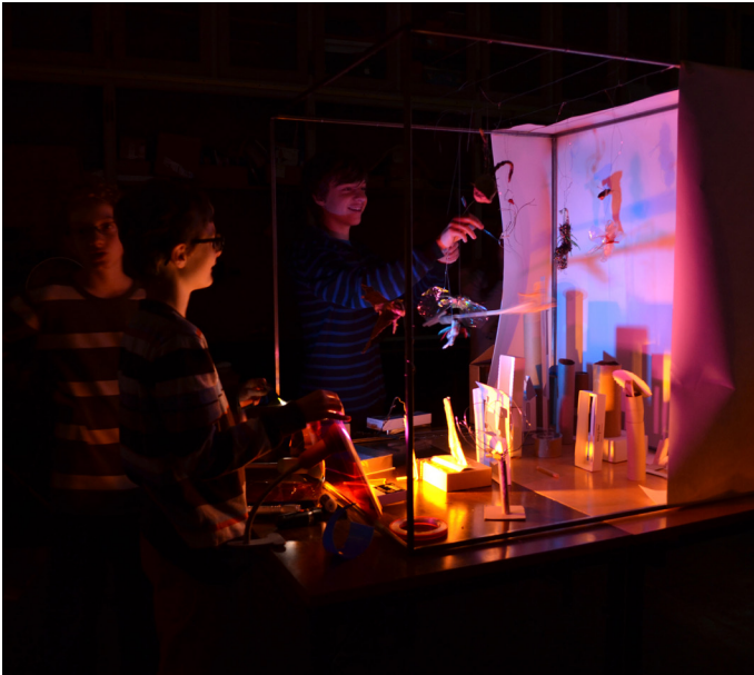
Gemeinsames Experimentieren mit selbstgebauten Objekten, Licht und Schattenspiel

Kinder und Jugendliche im Alter von 12–16 Jahren experimentieren mit Objekten, Lichtquellen und Soundcollagen, um gemeinsam ein Schattenspiel aufzuführen. Sie lernen die Wirkung eines dreidimensionalen Objektes als Schattenbild kennen, sowie das Spiel mit bewegtem und statischem Licht. Die digitale Bearbeitung der Tonaufnahmen unter Aspekten wie Tonhöhe und Klangfarbe lässt Geräusche zu Musik werden.