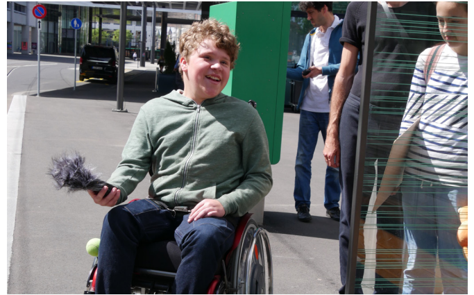
Tonaufnahmen an der Tramhaltestelle