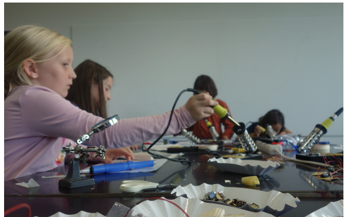
Gemeinsames Löten des Synthesizers