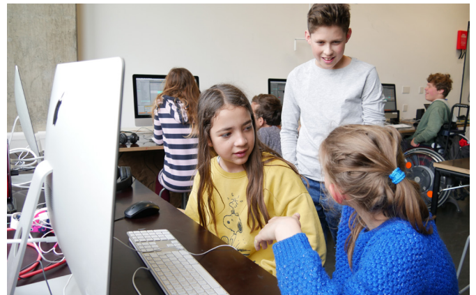
Tonaufnahmen collagieren mit Ableton Live