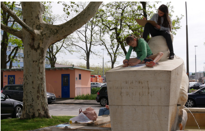
Zeichnen am und auf dem Brunnen