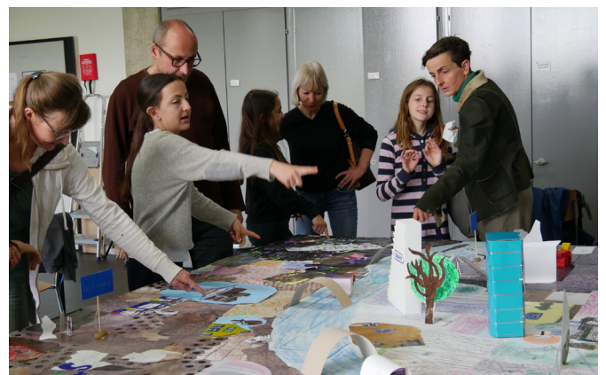
Präsentation der Collage mit Sound im Hintergrund