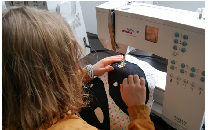
Zusammennähen mit der Nähmaschine