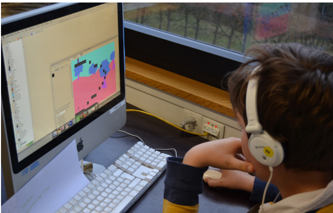
Debugging des eigenen Spiels – hm, wo liegt das Problem?