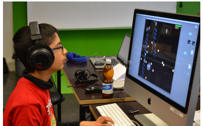
Testspiel – Neuer Rekord!