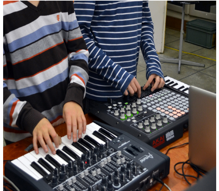
Spielen und Transformieren von Tonaufnahmen – es entsteht Musik für die Schlusspräsentation