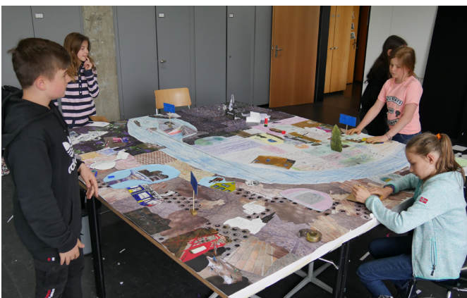
Arbeiten an einem gemeinsamen Plan