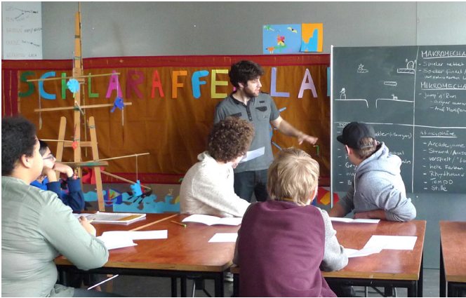
Skizzieren der Spielideen unter Einbezug verschiedener Kriterien wie Mikro- und Makromechanik

Kinder und Jugendliche im Alter von 12–16 Jahren erhalten die Gelegenheit, ein eigenes Computerspiel von A bis Z zu entwickeln. Sie lernen eine konkrete Spielidee zuerst auf einem Blatt Papier zu skizzieren, bevor sie diese am Computer umsetzen. Der Kurs Gamedesign, der ursprünglich als einwöchiges Workshop-Experiment startete, ist seit Jahren Teil des regulären Kursprogramms des K'Werks.