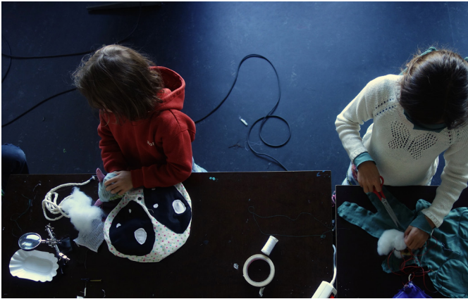
Arbeiten an der Aussenhülle des Kuscheltiers

Kinder im Alter von 9–13 Jahren designen und nähen ein eigenes Kuscheltier. Sie lernen, ihre Skizze mit Stoff, Schere und Nähmaschine umzusetzen, sowie einen kleinen Synthesizer mit Lautsprecher zu löten. Das fertige Kuscheltier reagiert mittels Sensoren auf Berührung mit eigenwilligen Sounds.