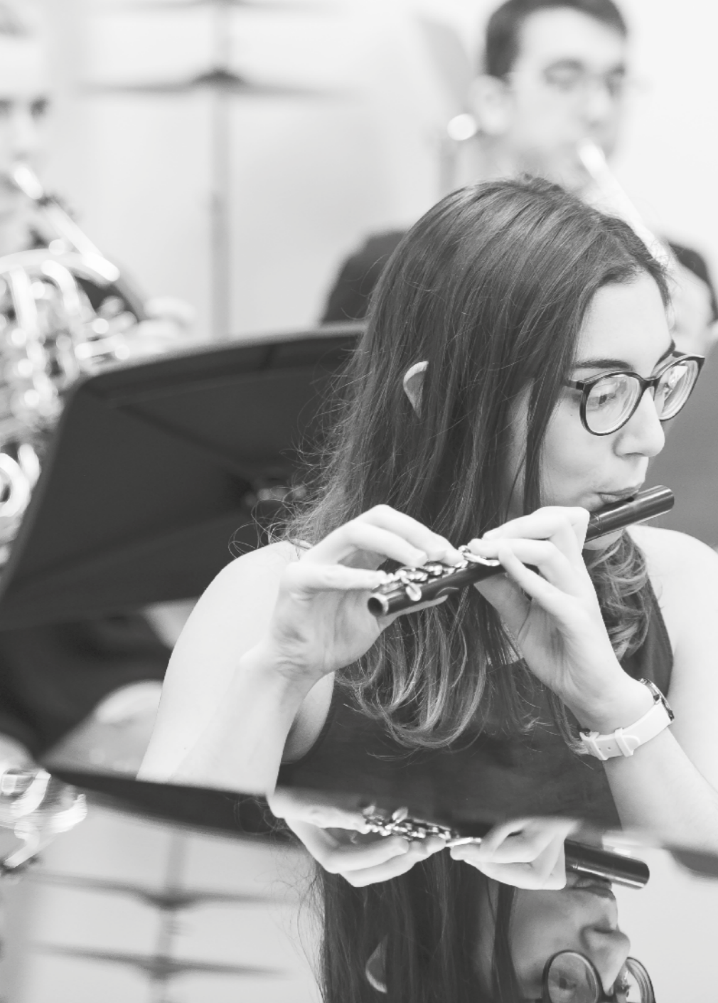
Proben und Auftritte: Der Schülerchor des Gymnasiums Muttenz und Studierende der Hochschule für Musik, Klassik eröffnen den neuen FHNW-Campus.