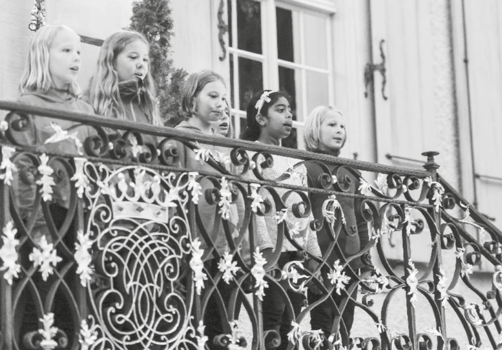
Chorsingen begeistert Kinder, Jugendliche und junge Erwachsene gleichermaßen: Auftritte im Wenken- und im Margarethenpark.